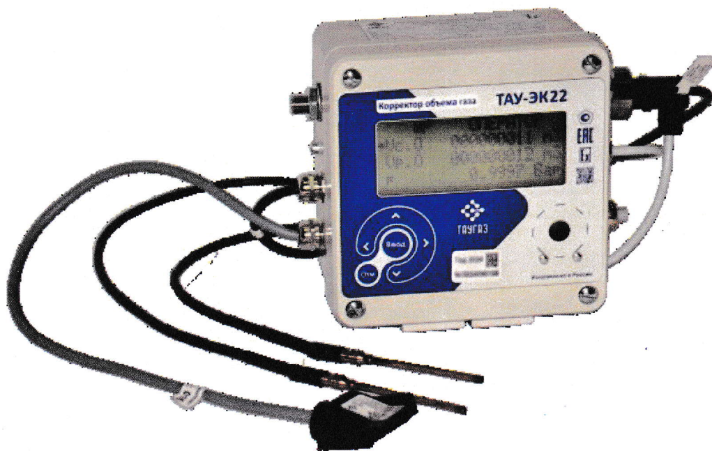
Рисунок 1 – Общий вид корректора

Корректор выполнен с видом взрывозащиты «искробезопасная электрическая цепь» уровня «ib» группы IIВ, может устанавливаться во взрывоопасных зонах, и имеет маркировку взрывозащиты IEx ib IIВ T4 Gb X.